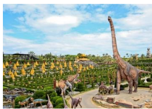
สวนนงนุช