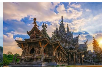
ปราสาทสัจธรรม