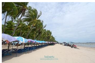
หาดบางแสน