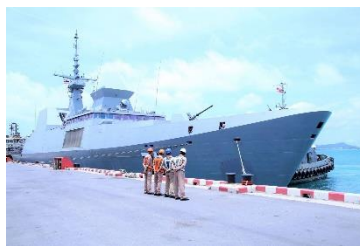
ฐานทัพเรือสัตหีบ