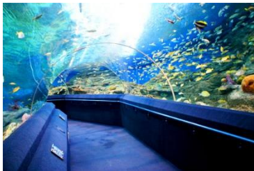
Underwater World พัทยา