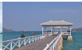
เกาะสีชัง