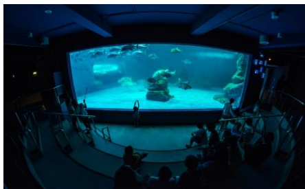
สถาบันวิทยาศาสตร์ทางทะเล