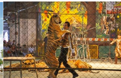
สวนเสือศรีราชา