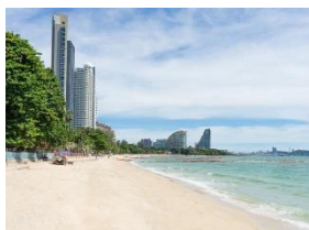
หาดพัทยา