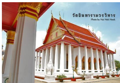
วัดใหญ่อินทาราม