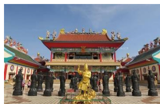
วิหารเซียน