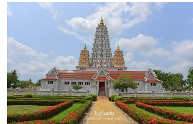
วัดญาณสังวรารามวชิราร