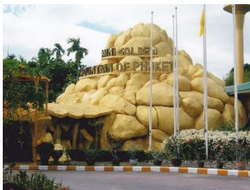
สวนผีเสื้อสายทิพย์