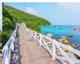
เกาะล้าน