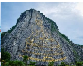
เขาชีจรรย์