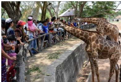
สวนสัตว์เปิดเขาเขียว