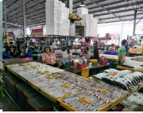
อ่างศิลา