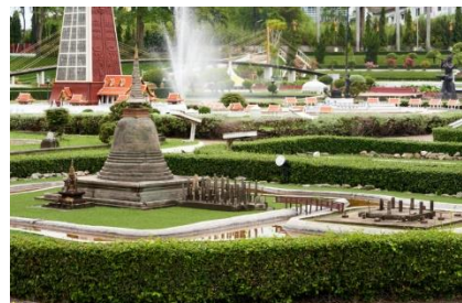
เมืองจำลอง