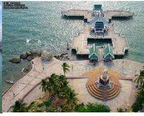
แหลมแท่น