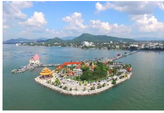
เกาะลอยศรีราชา