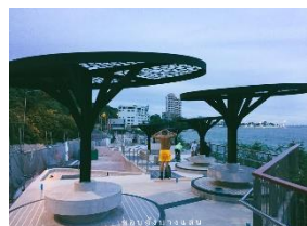
เขาสามมุข