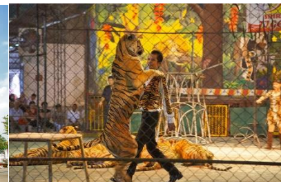
สวนเสือศรีราชา