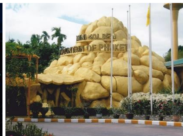
สวนผีเสื้อสายทิพย์